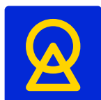
barevný znak SLOVANSKÉ UNIE z. s.